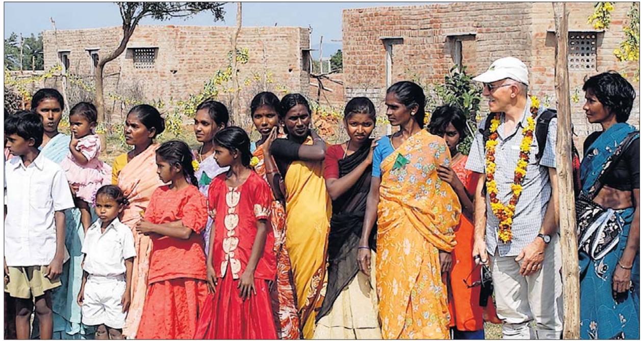
Frauen in bunten Saris, Männer in weissen Hemden und erwartungsvoll blickende Kinder bereiteten den Gästen aus Stäfa einen herzlichen Empfang.